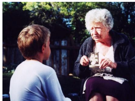
Cena de Dona Cristina Perdeu a Memória

> PRIMEIRO PACOTE DE FILMES FOI APRESENTADO NO MINISTÉRIO PÚBLICO - “Dona Cristina Perdeu a Memória”, “Festa de Casamento”, “O Branco” e “O Príncipe das Águas”. Estes foram os primeiros quatro filmes exibidos no auditório do Ministério Público, na avenida Aureliano de Figueiredo Pinto 80, no bairro Praia de Belas. Todas as primeiras terças-feiras de cada mês, às 12h e 15min., promotores de justiça, servidores do Ministério Público e a comunidade em geral poderão conferir filmes e documentários com conteúdos informativos e de entretenimento.