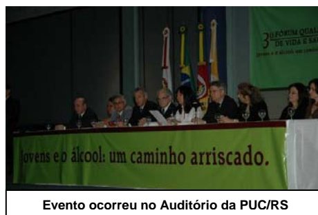
Evento ocorreu no Auditório da PUC/RS