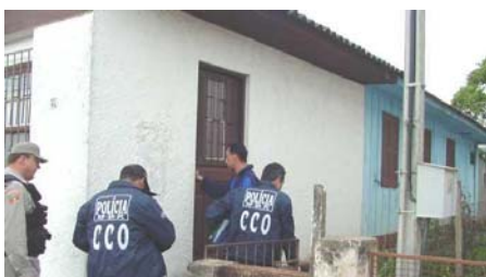
Mandados foram cumpridos

> ACUSADOS DE EXPLORAR ADOLESCENTES SÃO PRESOS - Seis exploradores de adolescentes detidos em uma ação que contou com apoio da Especializada Criminal de Porto Alegre foram ouvidos no Ministério Público de Cruz Alta. Quatro suspeitos foram surpreendidos no município situado na região Noroeste, e dois, em outras duas cidades do Estado. Foram cumpridos seis mandados de prisão temporária e sete de busca e apreensão.